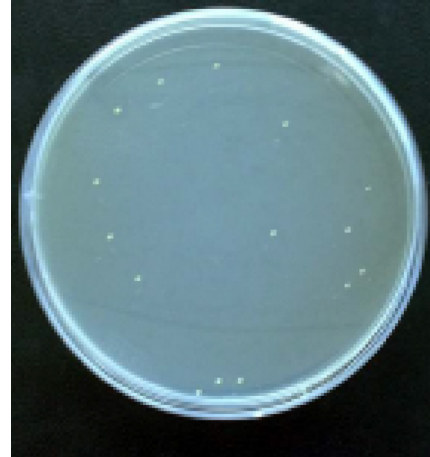
Bakterie Gule stafylokokker

Udregning af kludens evne til at opsamle bakterier: